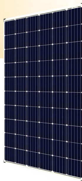
*根据需求可提供透明双玻组件产品。